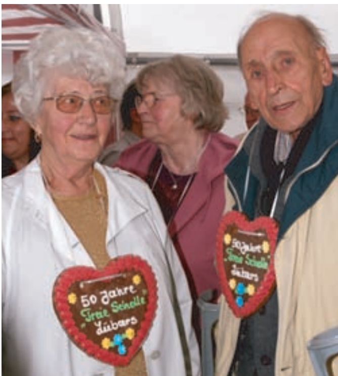
Zum Schluss erhielten alle Besucher vom Vorstand ein Lebkuchenherz zur Erinnerung an diesen gemütlichen Nachmittag.