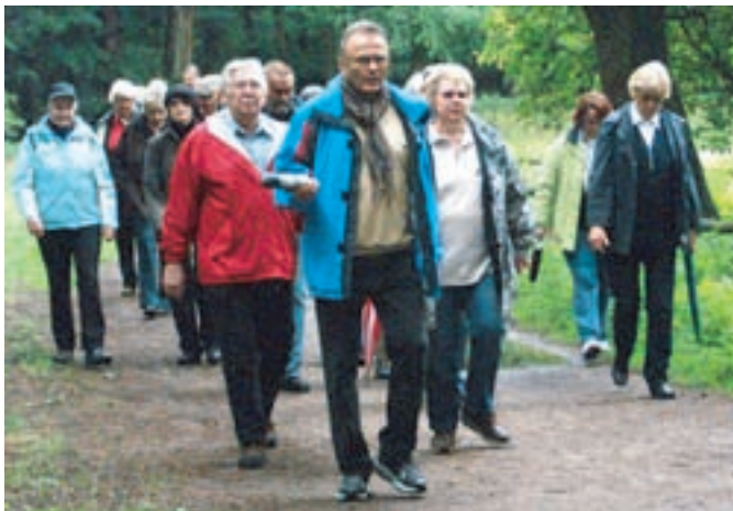
Glücklicherweise verlief die Wanderung im Trockenen. Die Schirme konnten in den Rucksäcken bleiben.