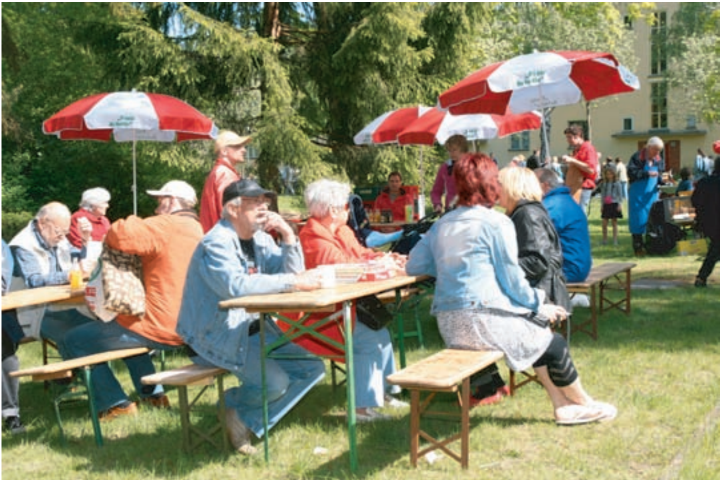
Das schöne Wetter lud auch zum Verweilen ein.