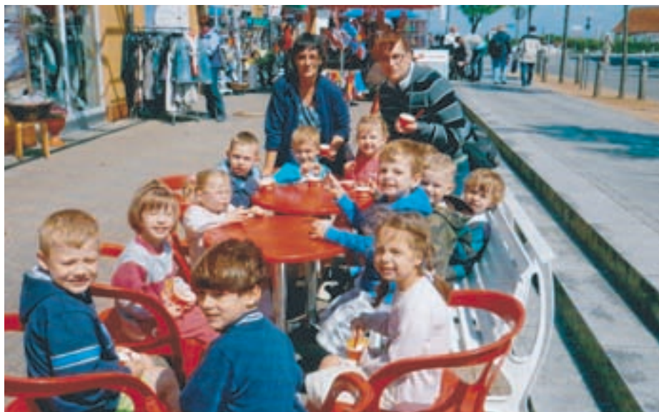
Fröhliche Kita-Kinder an der Ostsee

PS: Unser Dank gilt unserem Kooperationspartner „Freie Scholle“, die mit einer kleinen finanziellen Unterstützung 3 Kindern die Teilnahme an dieser Reise ermöglichte.