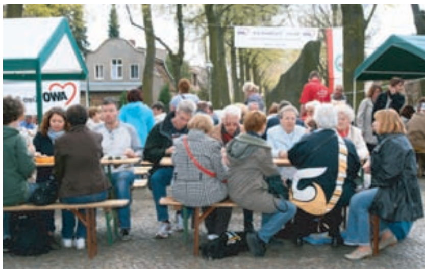
Die Veranstaltung am Rundteil der Egidystraße war bei bestem Wetter wie immer sehr gut besucht.