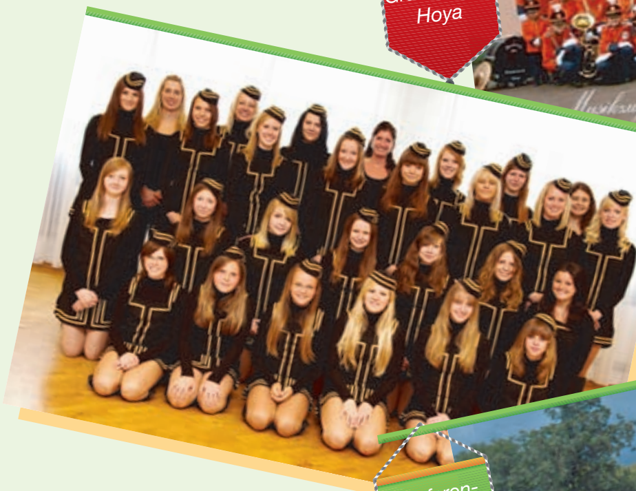
Fanfa- ren- zug Frie- drichshain