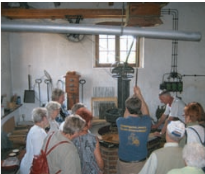
Der Besuch der Museumswindmühle war besonders interessant.