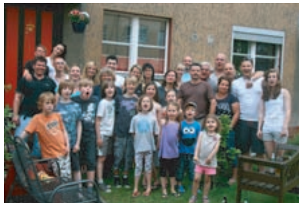
31 junge und ältere Schollaner aus dem hinteren Allmendeweg machten sich auf den Weg nach Trassenheide.

Spielen, Buddeln, Baden und Bräunen ein. Auch unterschiedliche Möglichkeiten des Verweilens wurden getestet: Strandkorb, Handtuch und gar ein mitgebrachter Klappstuhl. Die Verpflegung war durch frischen Fisch und Grillfleisch sichergestellt. Auch Getränke aller Art waren vorhanden.