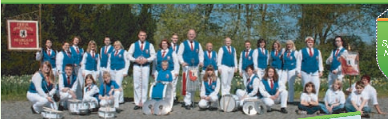
1. Majorettencorps Berlin