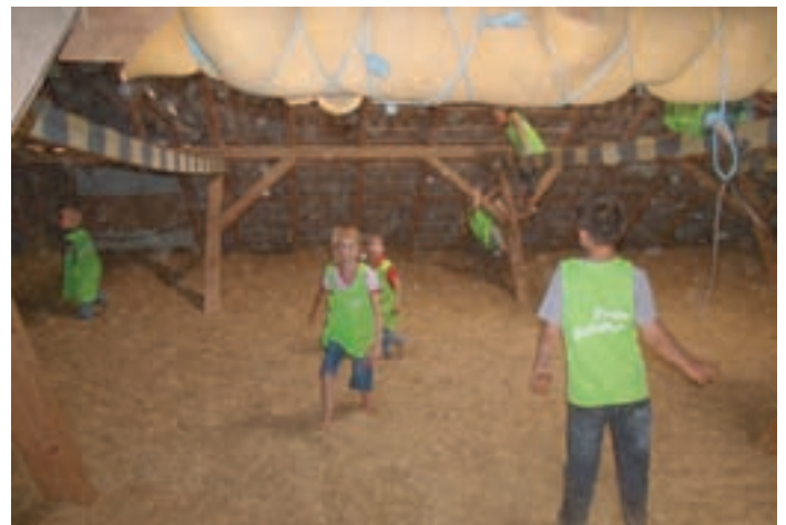
Toben auf dem Heuboden, wer würde da nicht gerne mitmachen?