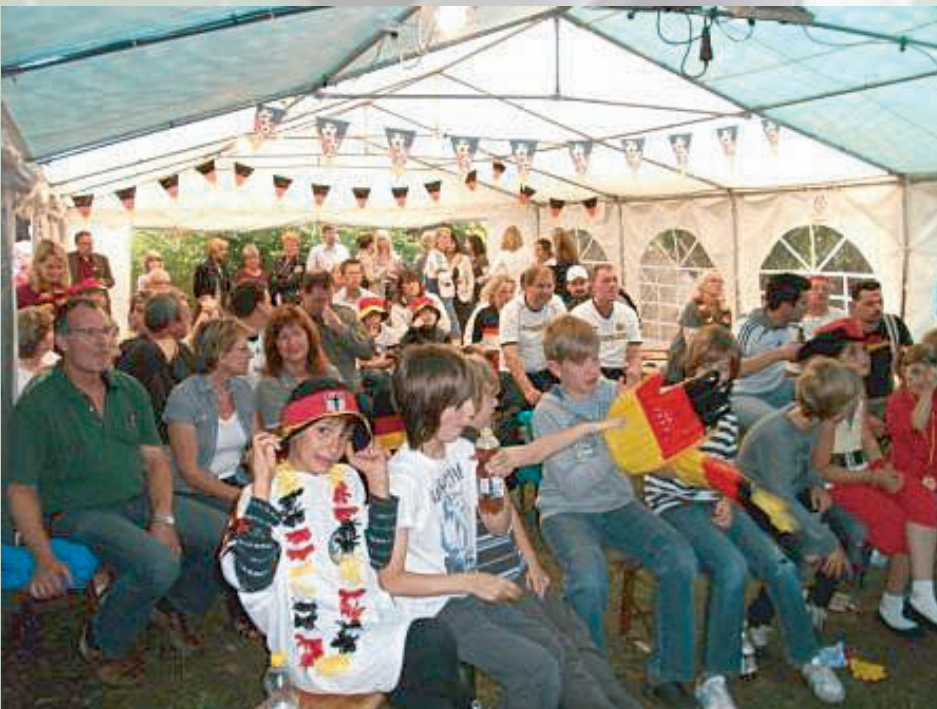
Das Großzelt in der Jugendfreizeitstätte war leider nicht voll gefüllt.