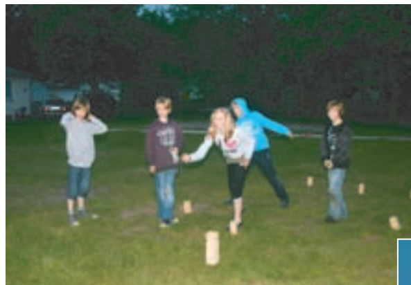
Bei Sport und Spiel ...