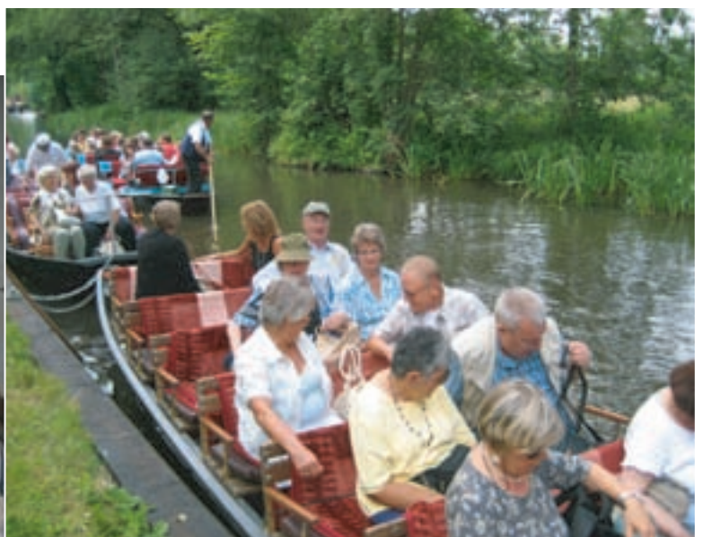
Im Mittelpunkt der Tour stand natürlich die erholsame Kahnfahrt.