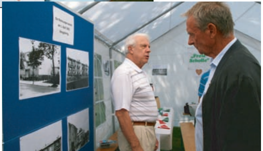
Eine kleine Fotoausstellung erinnerte an die Anfänge unserer Siedlung Lübars.

Sachbeschädigungen kosten das Geld aller Mitglieder. Helfen Sie mit, Vandalismus-schäden zu verhindern.