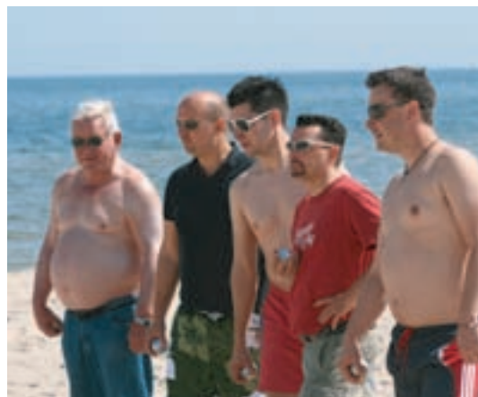
... verging die Zeit wie um Flüge

So verbrachten wir drei wunderschöne Tage, die wir abends am Lagerfeuer ausklingen ließen. Aber leider mussten wir die Insel dann auch wieder verlassen. Über die gut ausgebaute und wenig befahrene Autobahn kamen alle gesund wieder in der Heimat an, so dass gemeinsam auf den gelungenen Kurztrip angestoßen werden konnte.