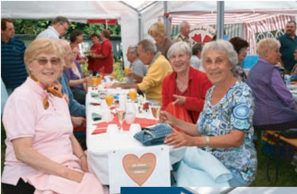
Das Festzelt war schnell gefüllt. Alle Tische waren von den Beiratsshelferinnen liebevoll geschmückt.

Zum Schluss erhielten alle Besucher ein Lebkuchenherz zur Erinnerung an dieses Siedlungsjubiläum.