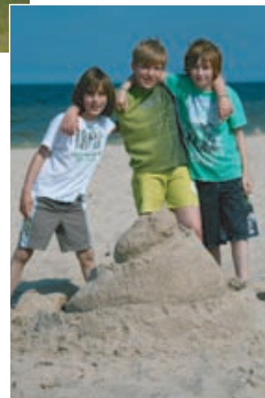
Die 3 jungen Baumeister zeigen stolz ihre Sandburg