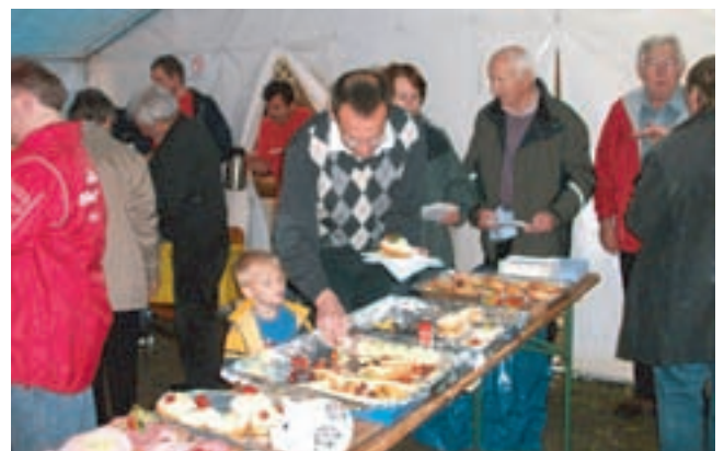
Für alle Teilnehmer gab es am Schluss ein köstliches Frühstück in der Jugendfreizeitstätte.