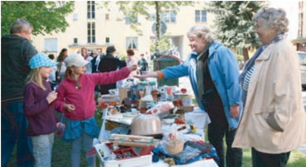
Pünktlich um 9.00 Uhr herrschte an allen Ständen ein großer Andrang.