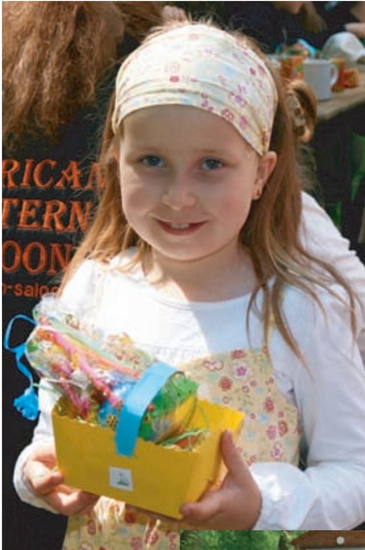
Wie man sieht, haben diese Nester große Freude ausgelöst.