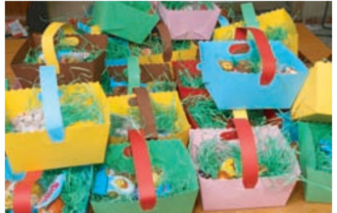
In der Jugendfreizeitstätte erhielt jeder Jugendliche dann am Schluss ein wunderschönes Osternest.

Helfen Sie mit, Ruhe- störungen zu vermeiden.