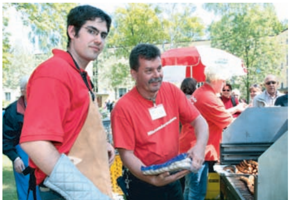
Die Männer vom Grill hatten alle Hände voll zu tun. Trotzdem bildeten sich lange Warteschlangen.