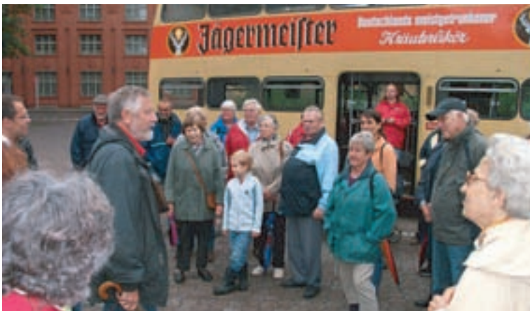
An der Tegeler Mühle wurden die Schollaner in 3 Gruppen eingeteilt