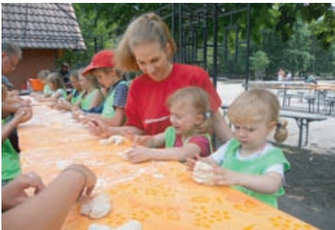
Mehl und Teig haben schön an den Händen geklebt.