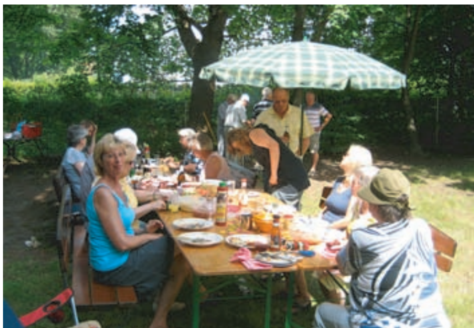
Es war wirklich eine gemütliche Runde. Typisch Alt-Wittenau!