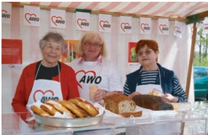
Viele ehrenamtliche Helferinnen und Helfer arbeiteten sehr fleißig, um allen Besuchern das reichhaltige Speisen- und Getränkeangebot zu präsentieren.