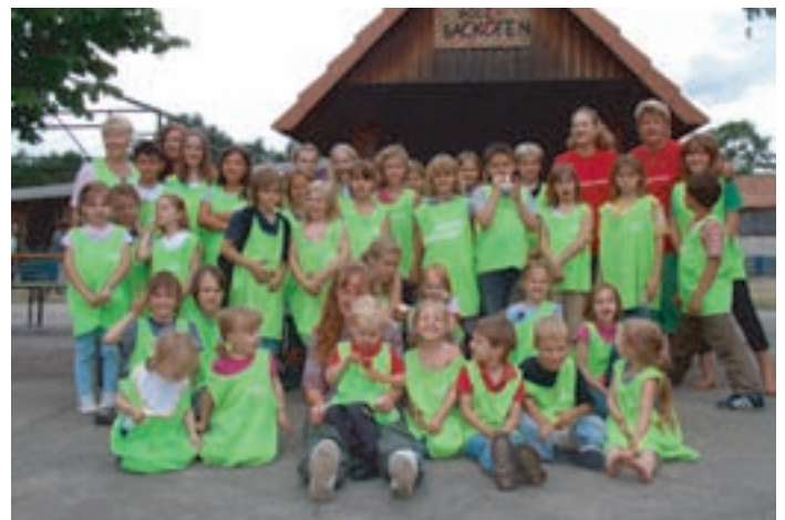
Am Ende reichte die Kraft gerade noch zum obligatorischen Gruppenfoto.