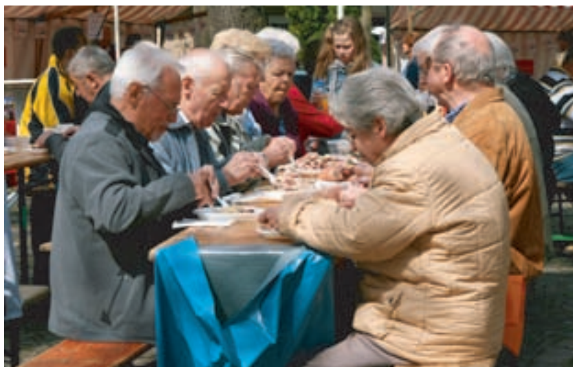
Es hat allen Besuchern wieder hervorragend geschmeckt.

Meldungen über defekte Straßenlaternen mit genauer Standortangabe und möglichst auch der Nummer am Laternenmast telefonisch an die Nuon Stadtlicht GmbH