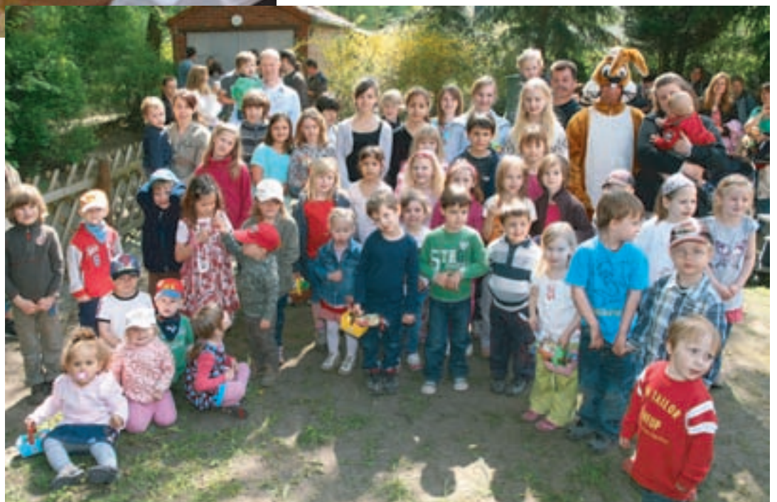
Das obligatorische Abschlussfoto mit dem Osterhasen in der Jugendfreizeitstätte

Von 22 Uhr bis 7 Uhr sollte es ruhig sein.