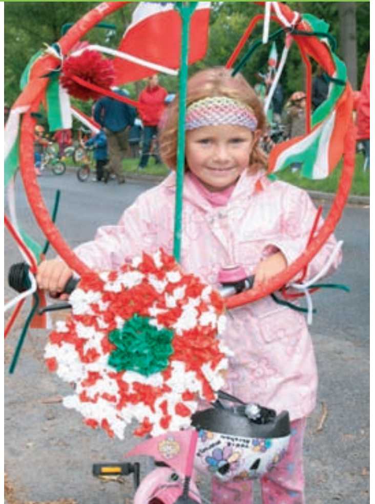
Diese beiden jungen Schollanerinnen sind schon perfekt auf den großen Fahrradkorso vorbereitet.

Auch zum diesjährigen Schollenfest werden uns wieder mehrere Musik- und Spielmannszüge besuchen und die große Musikshow und den Fest- und Fackelzug musikalisch umrahmen. Alle Schollaner, Berliner und Brandenburger sind herzlich eingeladen. Das Festprogramm ist auf den nächsten Seiten abgedruckt. Also, auf zum Schollenfest 2011!