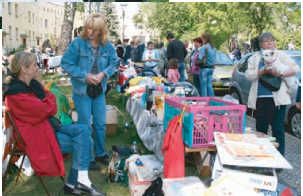
Die Geschäfte gingen so gut, dass alle Trödelnden im nächsten Jahr wieder dabei sein werden.