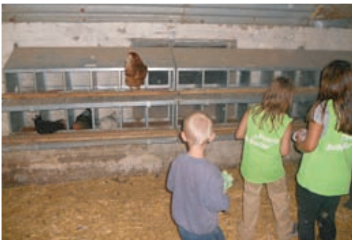
Jedes Kind durfte 4 Eier dem Gelege entnehmen.