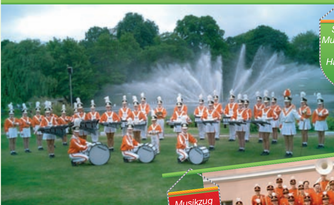
Show- Musikkorps Ahoy Hamburg