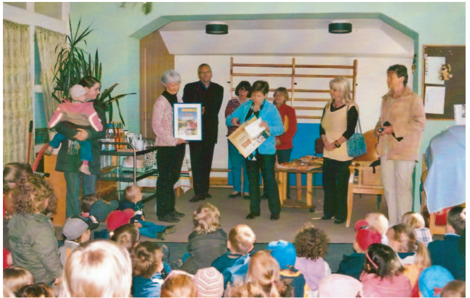
Es war für alle ein schöner Moment, als der Scheck über 500,- EUR den anwesenden Kindern überreicht wurde.