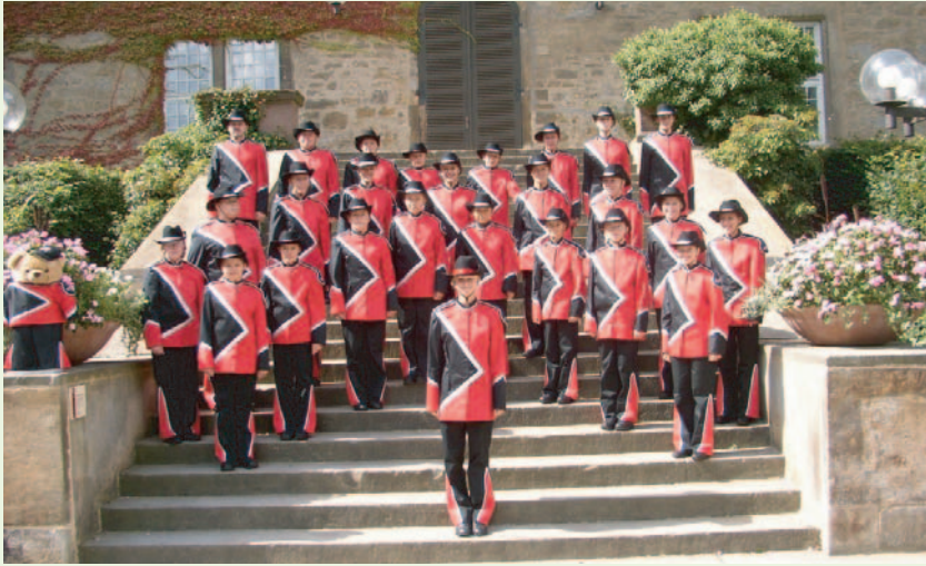
Magic Flames Hattorf