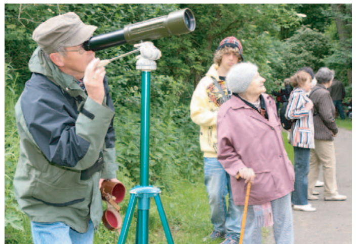
Was man doch alles durch so ein Super-Fernglas entdecken kann.