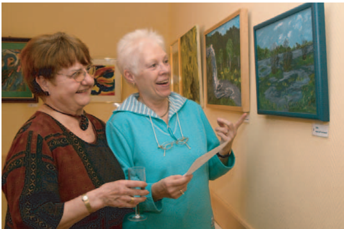
Bei der Ausstellungseröffnung schauen sich diese beiden Besucherinnen die Bilder von Helga Heuer an.