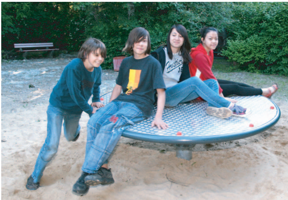
Das neue Spielgerät wurde sofort von den jungen Schollanern in Besitz genommen.