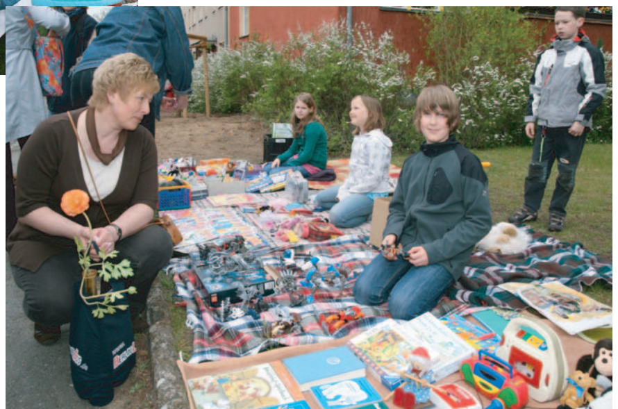
...war selber schuld.