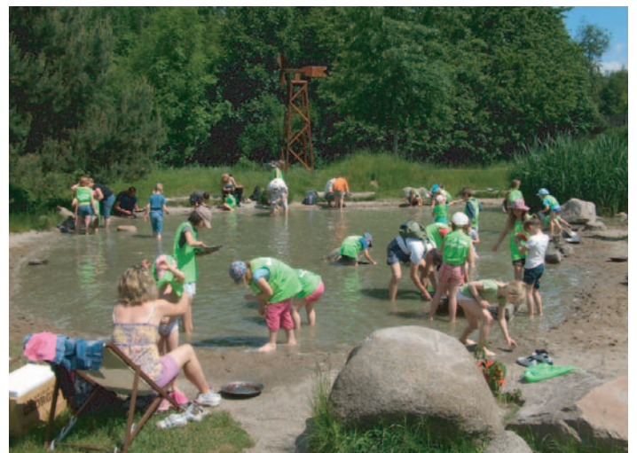
Alle Schollenkinder auf der Goldsuche und beim Badespaß.