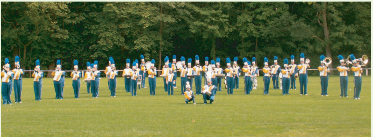
Fanfarezug- und Spielmannszug Hahn-Nethen