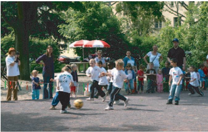
Auf dem Bolzplatz im Schollenhof ging es heiß her.