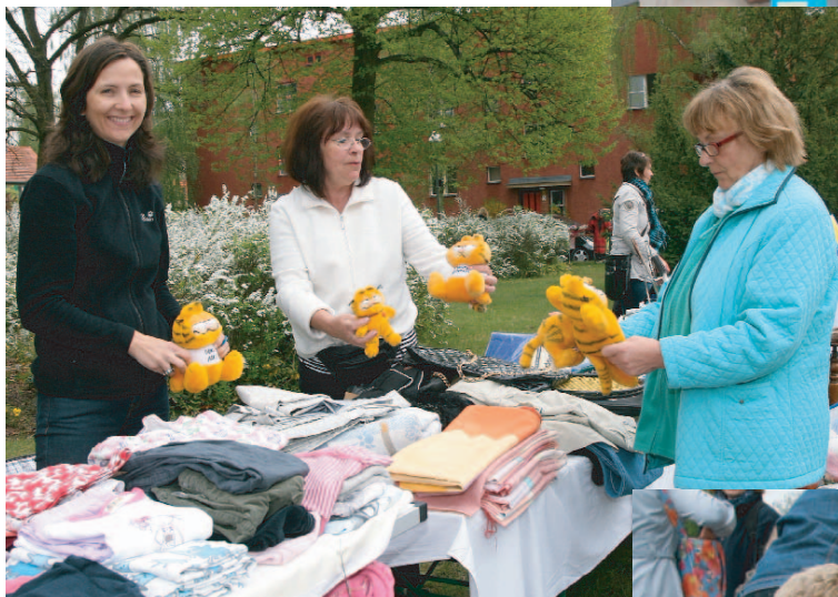
Wer da nichts gefunden hat ...