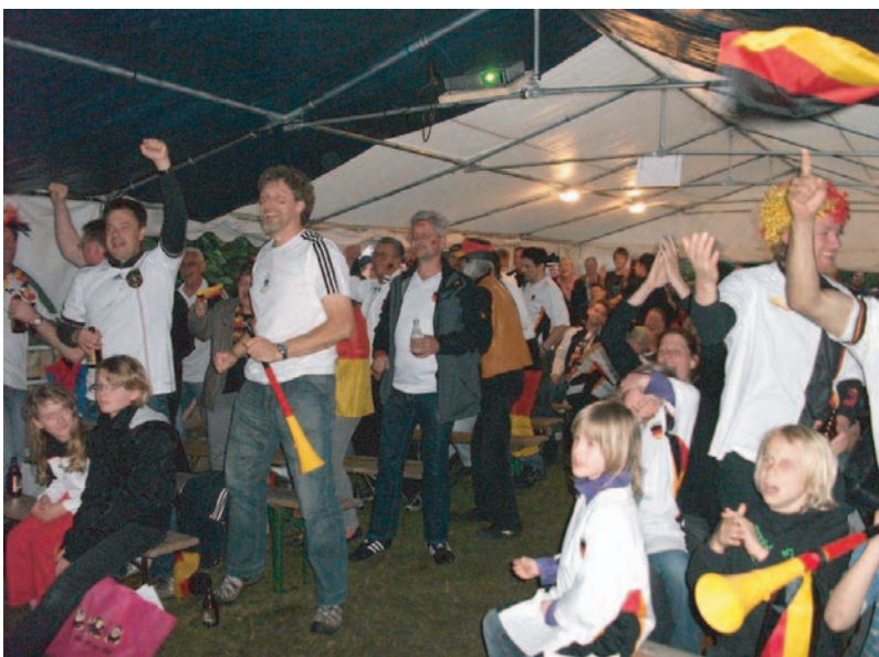
Die Tore der deutschen Mannschaft wurden frenetisch bejubelt.