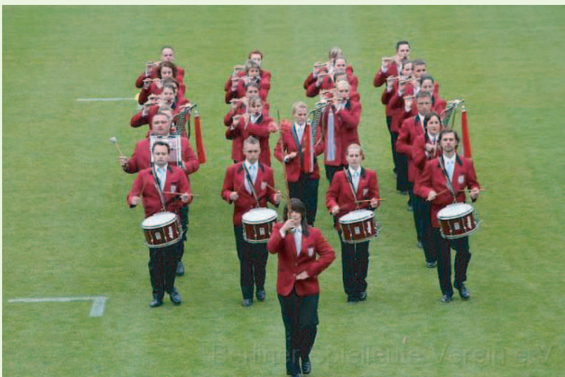
Berliner Spielleute Verein