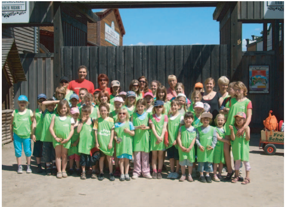
Vor der Abfahrt versammelten sich alle Schollaner zum Erinnerungsfoto.