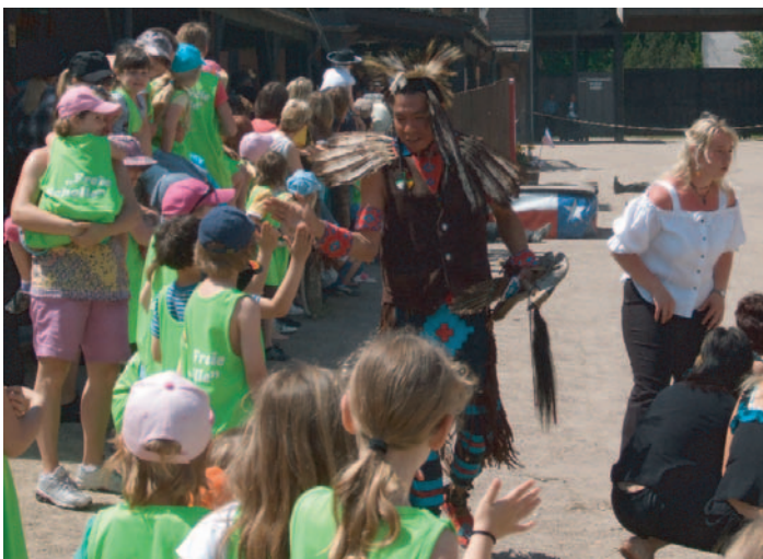
Der Häuptling begrüßte alle Gäste per Handschlag.