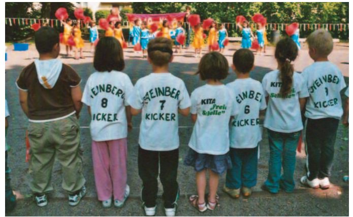
Die Zuschauertribünen waren gut gefüllt. Im Hintergrund erkennt man die Cheerleader aus Neukölln.