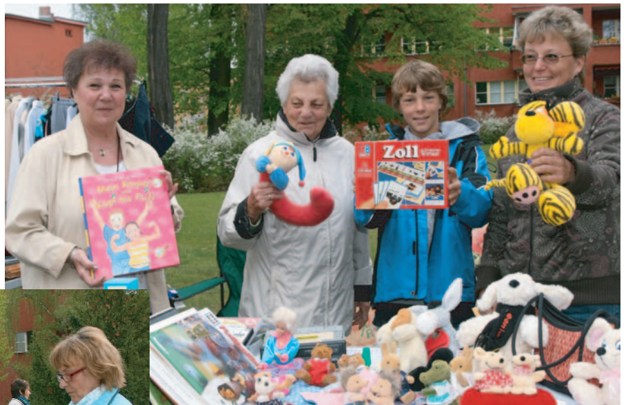
Die Auswahl war riesengroß!