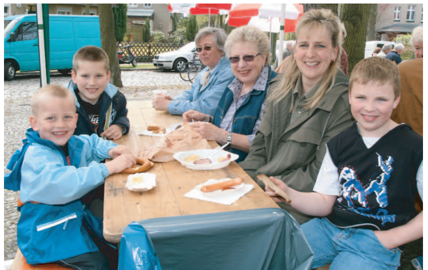
Es hat wirklich allen gut geschmeckt.

Von 22 Uhr bis 7 Uhr sollte es ruhig sein.