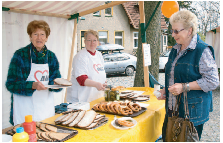
Der Lebensmittelverkauf war wie immer bestens organisiert.

Als die AWO gemeinsam mit der „Freien Scholle“ Ende April wieder zum Schlachtfest geladen hatte, war diesmal der Wettergott voll auf ihrer Seite. Am Rundteil in der Egidystraße füllten sich die Tische und Bänke schnell mit hungrigen Schollanern und AWO-Freunden. Die Gäste hatten offenbar im Laufe der Jahre gelernt, dass es bei der Veranstaltung um ein gemütliches gemeinsames Essen geht und nicht darum, sich mit Eisbeinen für die heimische Mahlzeit einzudecken.