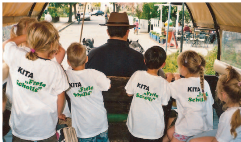
Eine Kutschfahrt scheint wirklich sehr interessant zu sein.