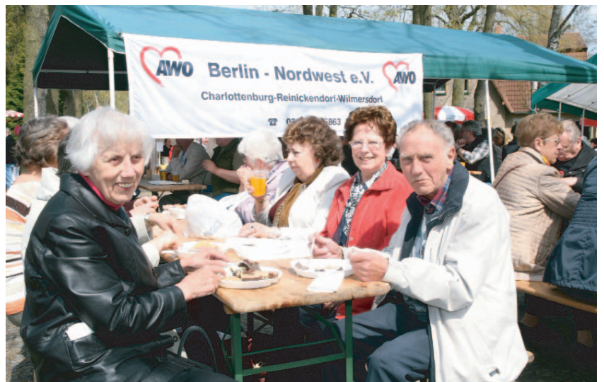
Na dann, guten Appetit!

Ein wichtiger Dank gilt übrigens allen, die Bänke, Tische, Zelte und Stände geschleppt und aufgebaut oder Eisbeine und andere Speisen sowie Getränke besorgt haben. Natürlich auch denjenigen, die Kuchen gebacken und verkauft haben, dem DJ, der für musikalische Untermalung sorgte – und den fleißigen Helfern, die hinterher alles wieder abgebaut haben!