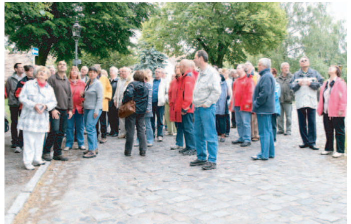
Gleich nach der Ankunft in Lübars wurden die 86 Teilnehmer in 3 Gruppen aufgeteilt.