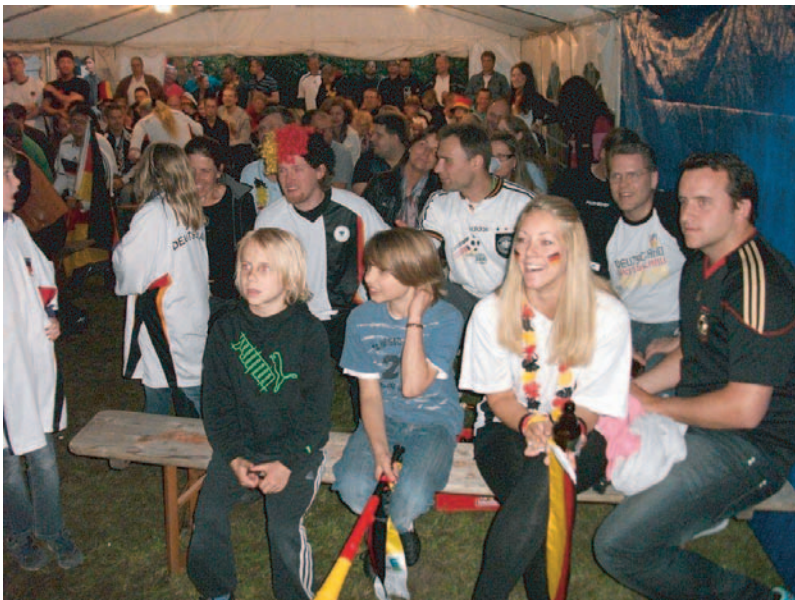
Das Zelt war bei allen Spielen der deutschen Mannschaft gut gefüllt.

Alle Spiele der Deutschen Nationalmannschaft wurden übertragen. Das neue – besonders große – Zelt des Beirates war bei jedem Spiel voll. Im Durchschnitt besuchten ca. 100 fußballbegeisterte Schollaner die Deutschland-Spiele.