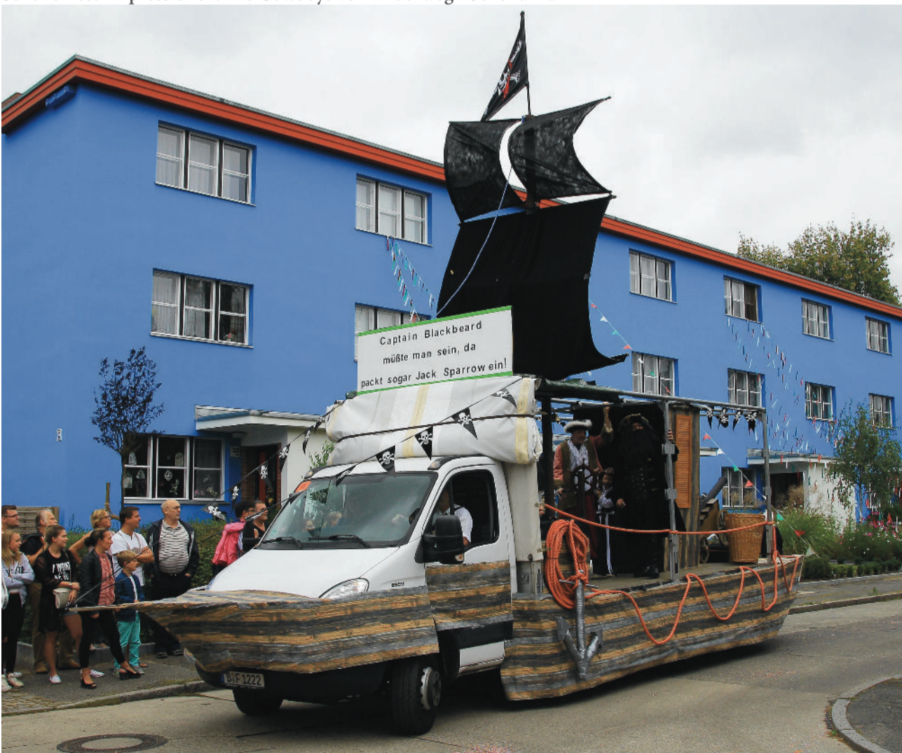
Schollenfest-Impressionen: Das Piratenschiff von Karl Kießling und seiner dunklen Mannschaft

Jung-Redakteur für Kinder- und Jugendseite im Mitteilungsblatt gesucht! Interessenten melden sich bitte telefonisch unter 438 000 22