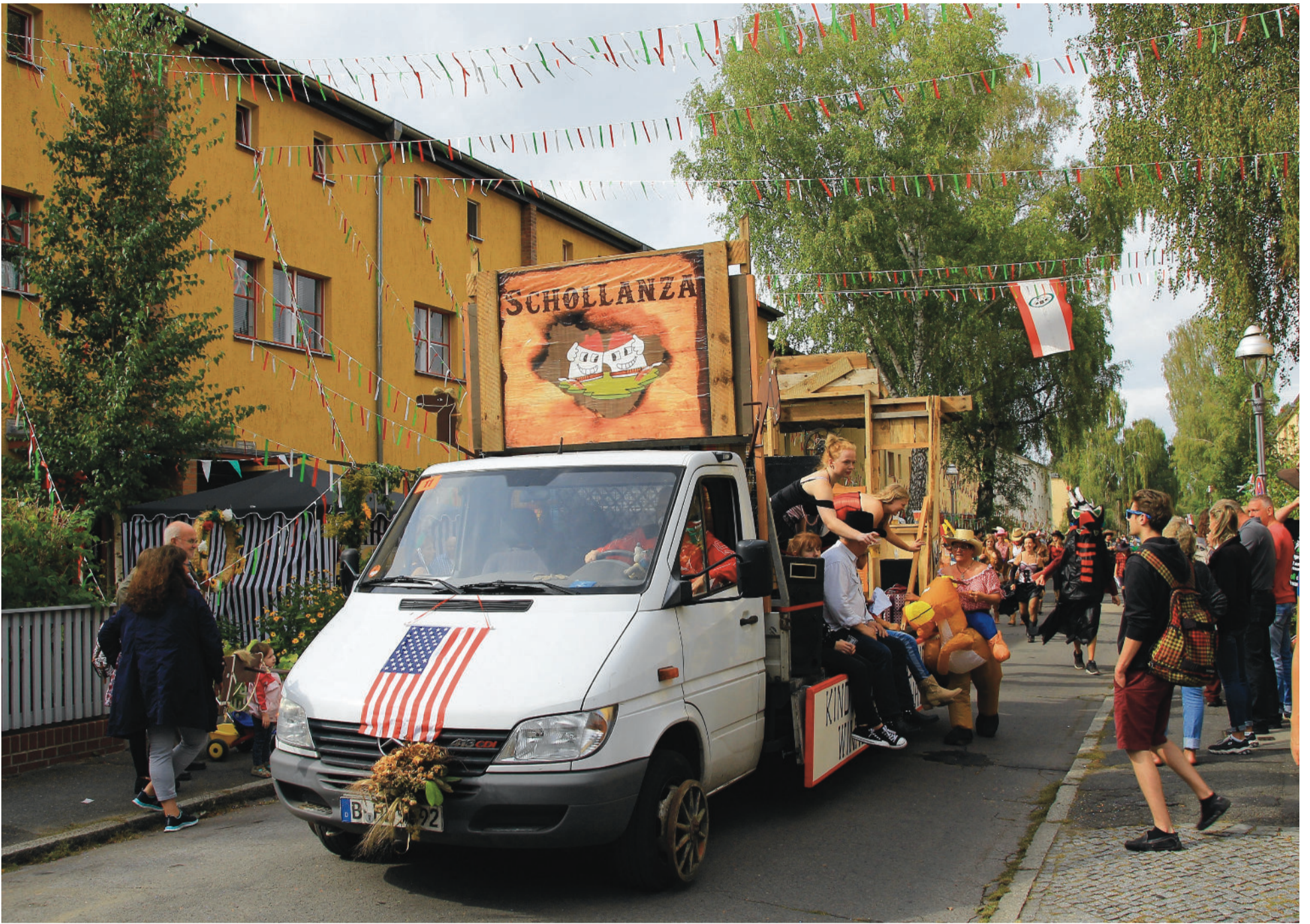
Schollenfest-Impressionen: Die Cowboys vom Moorweg - Schollanza