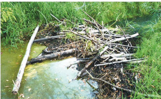
Biberdamm am Wickhofgraben

Seit mehr als zehn Jahren werden Biber im Tegeler Fließtal beobachtet. Mit ihren Bauten tragen sie besonders in diesem heißen Sommer mit seinen geringen Niederschlagsmengen zur Regulierung des Wasserstandes im Tegeler Fließtal bei. An der Fließbiegung kurz vor dem St.-Joseph-Steg in Tegel kann man schon vom Wanderweg aus einen etwa 30 cm hohen Damm aus unterschiedlich dicken Ästen sehen, an dem sich das Wasser des Tegeler Fließes aufstaut. Schlamm und Lehm sorgen für die Dichtigkeit des Damms. Es gibt keine Zweifel: Hier waren Biber aktiv, um ihren Lebensraum ausreichend feucht zu halten und damit den Unterwassereingang ihrer Burg durch die Stauung weiter nutzen zu können.