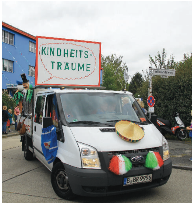
Schollenfest-Impressionen: Der Wagen mit dem Motto des Schollenfestes

Wir werden ihn in bester Erinnerung behalten.