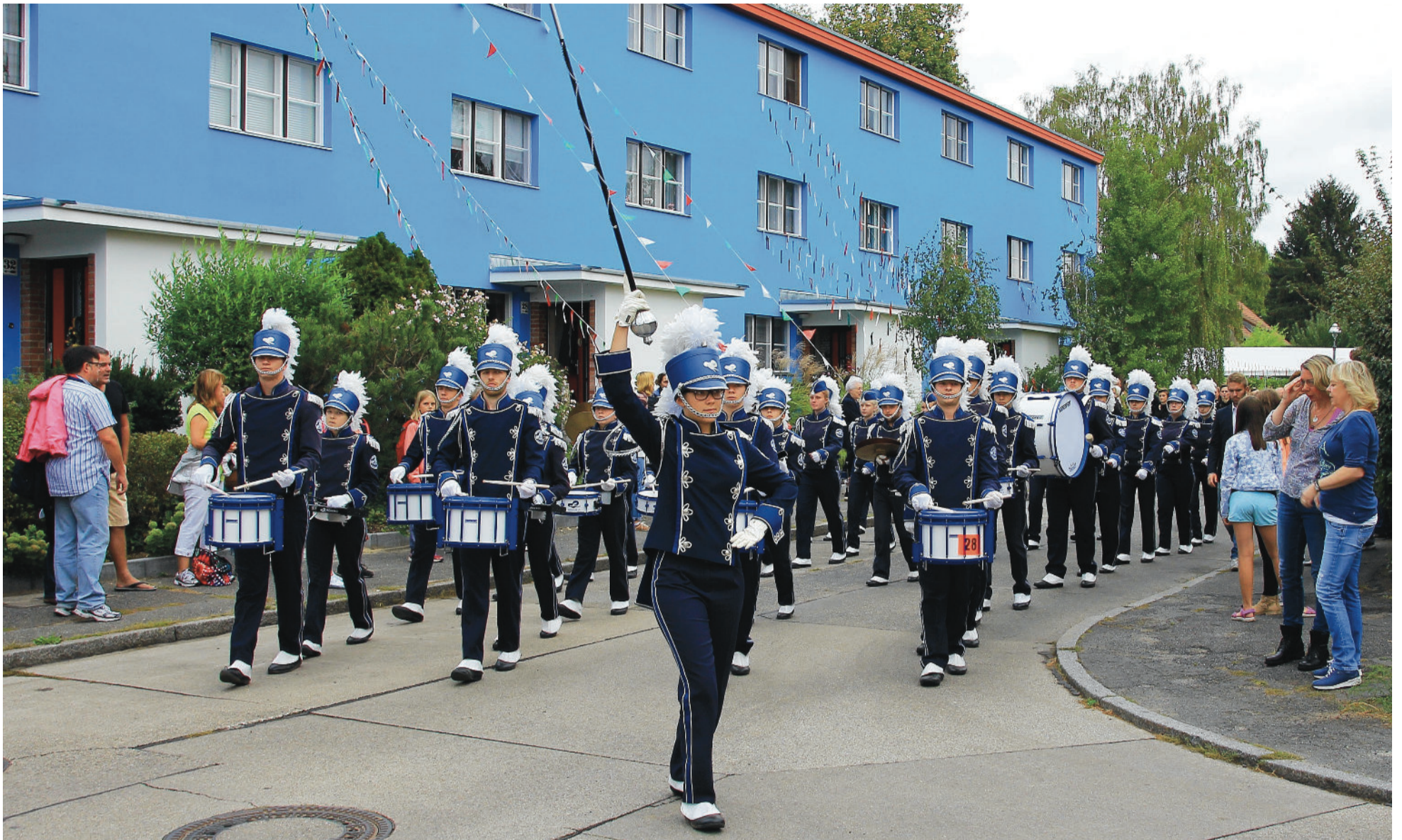
Der Spielmansszug &amp; das Jugendblasorchester Rödemis e.V.