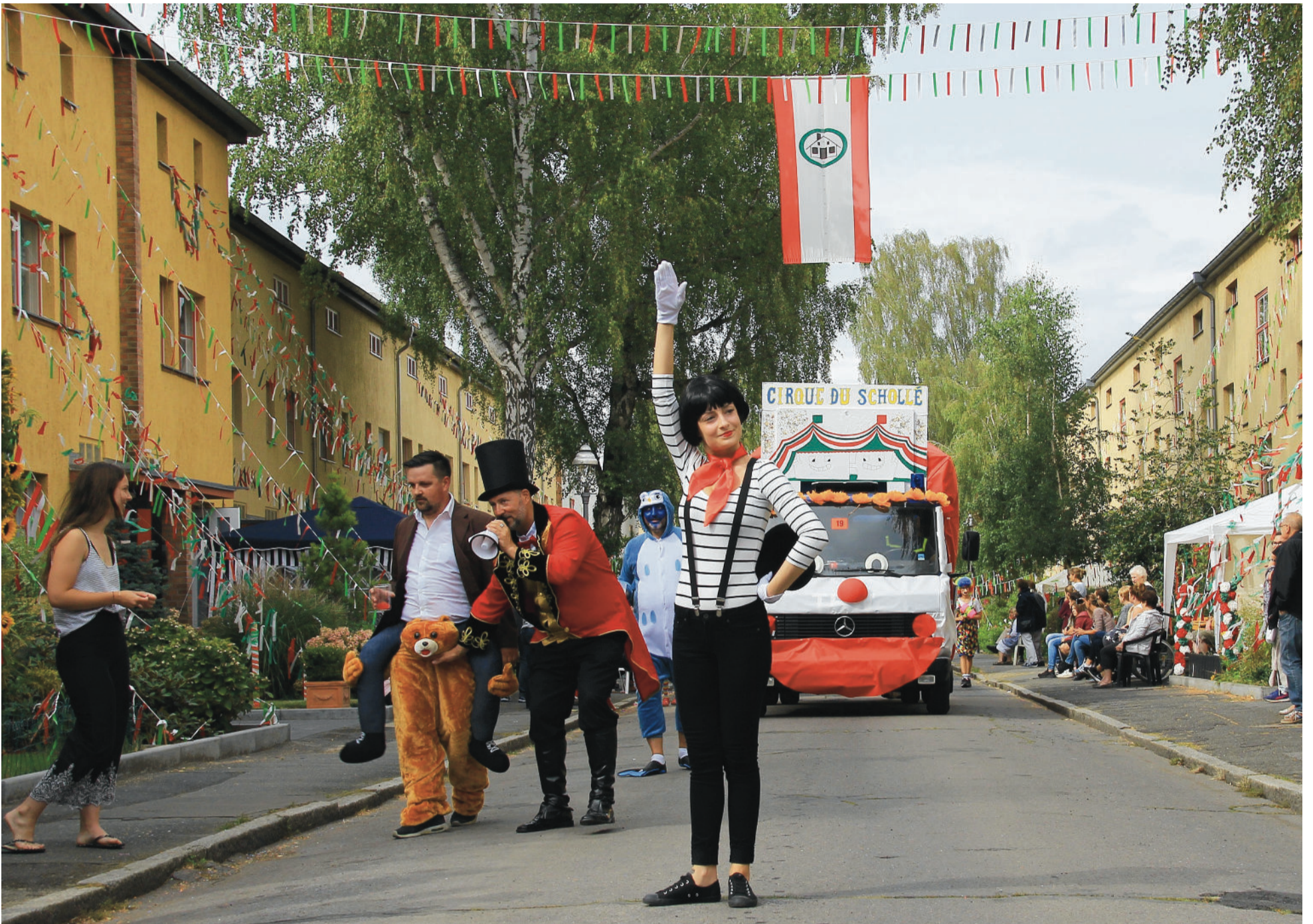
Schollenfest-Impressionen: Cirque du Scholle aus dem Allmendeweg