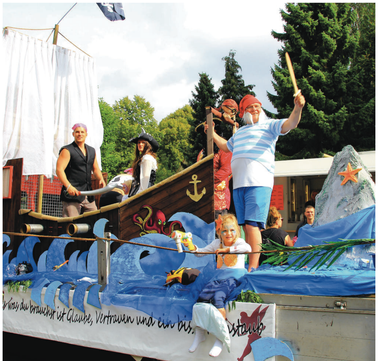
Schollenfest-Impressionen: Peter Pan und die Meerjungfrauen aus der Egidystraße und dem Talsandweg