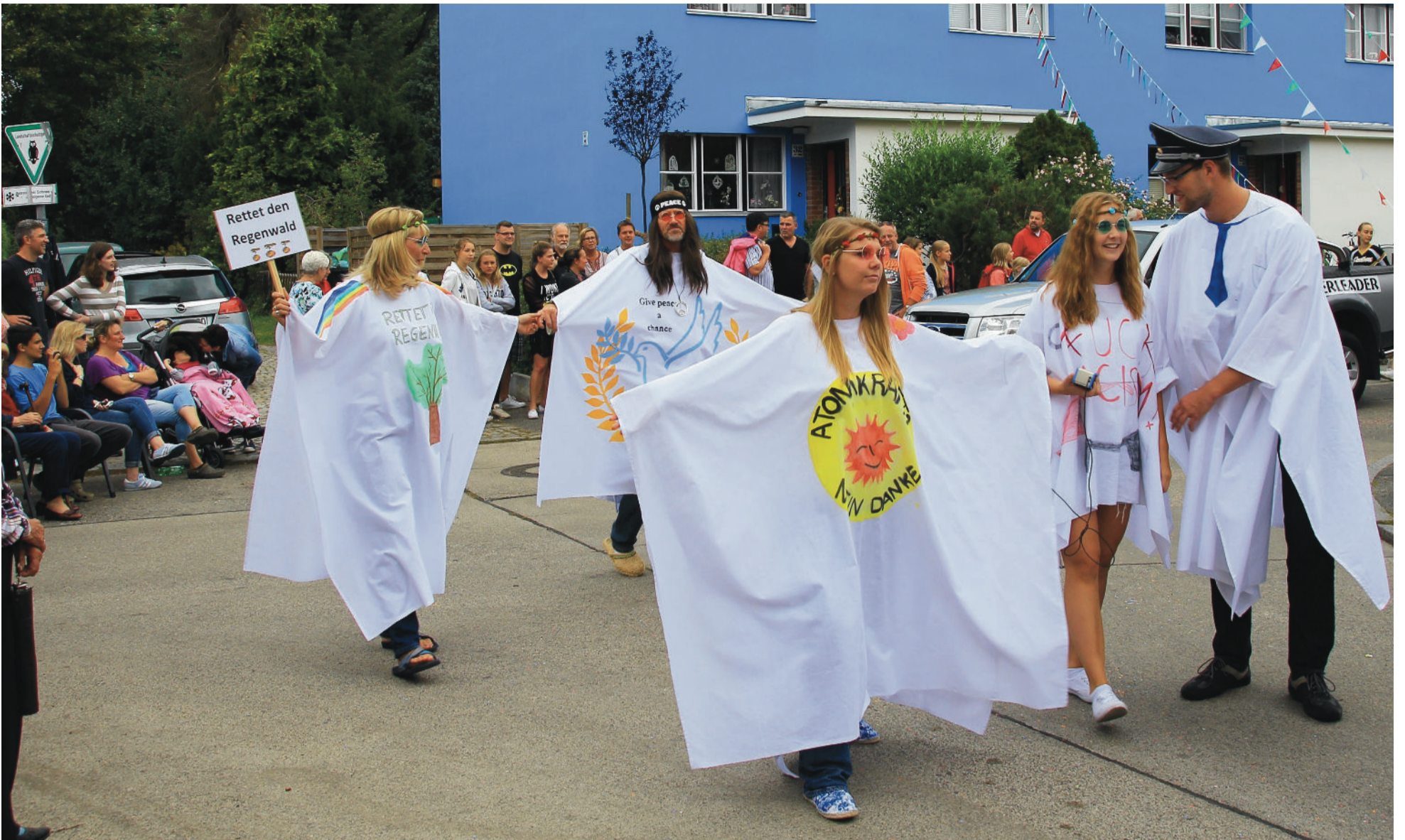
Schollenfest-Impressionen: Circus du Schollé aus dem Allmendeweg (oben) | Rettet den Regenwald und die "Freie Liebe" (unten)