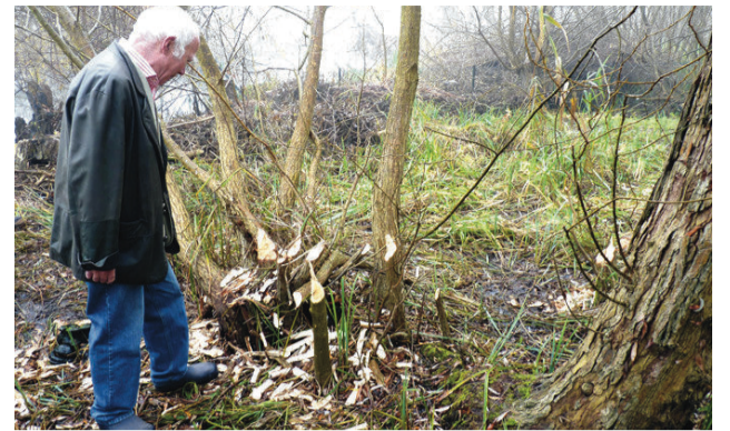
Biber-Schnitt in Engelkes Sumpfgarten

Ein Anwohner hat mit einer Fotofalle interessante Videoszenen von der nachtaktiven Biberfamilie aufgenommen. Die Aufnahmen zeigen auch, dass Biber und der dämmerungsaktive Bisam dicht nebeneinander wohnen können. Im Laufe der letzten Jahre hat sich der