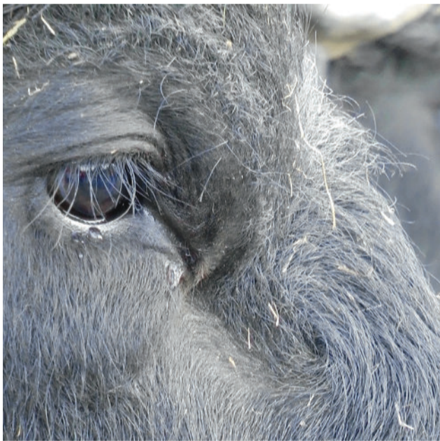
"Wasserbüffel im Tegeler Fließtal"

DVD-Dokumentation des ersten Jahres - 2015 - der Wasserbüffel auf den Fließwiesen