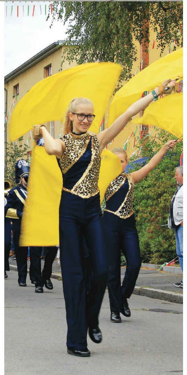
Die Cheerleader des Drum Corps Blue Lions Rastede

Weitere Tipps um böse Buben fern zu halten, gibt es in der nächsten Ausgabe.