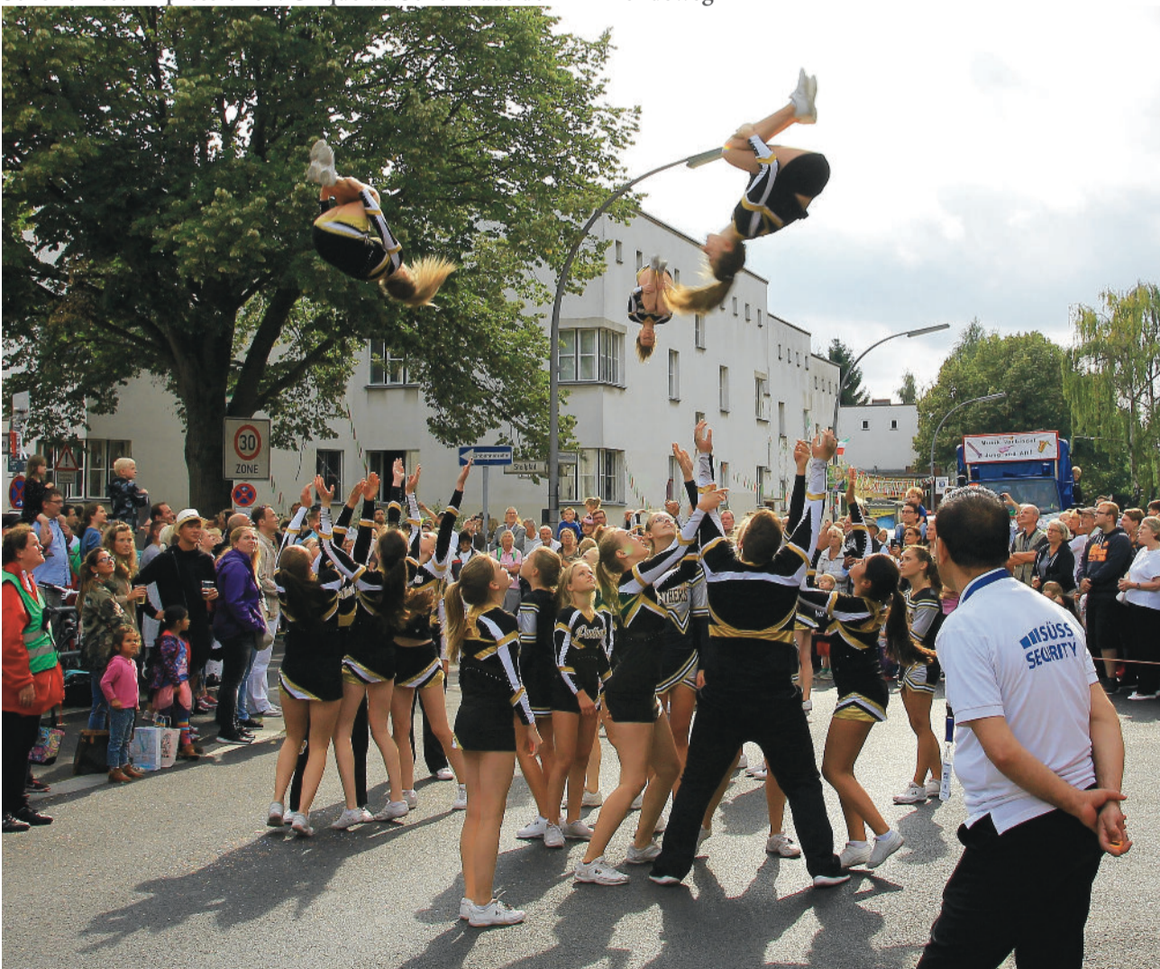
Schollenfest-Impressionen: Die Cheerleader des PCV Potsdam Panthers e. V.

Für Interessierte: die nächste Beiratssitzung ist am 11. Oktober um 19.30 Uhr in der Jugend- und Freizeitstätte Waidmannsluster Damm 80