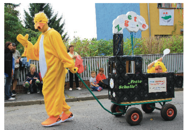
Schollenfest-Impressionen: Die Zugente

Für Interessierte: die nächste Beiratssitzung ist am 11. Oktober um 19.30 Uhr in der Jugend- und Freizeitstätte Waidmannsluster Damm 80