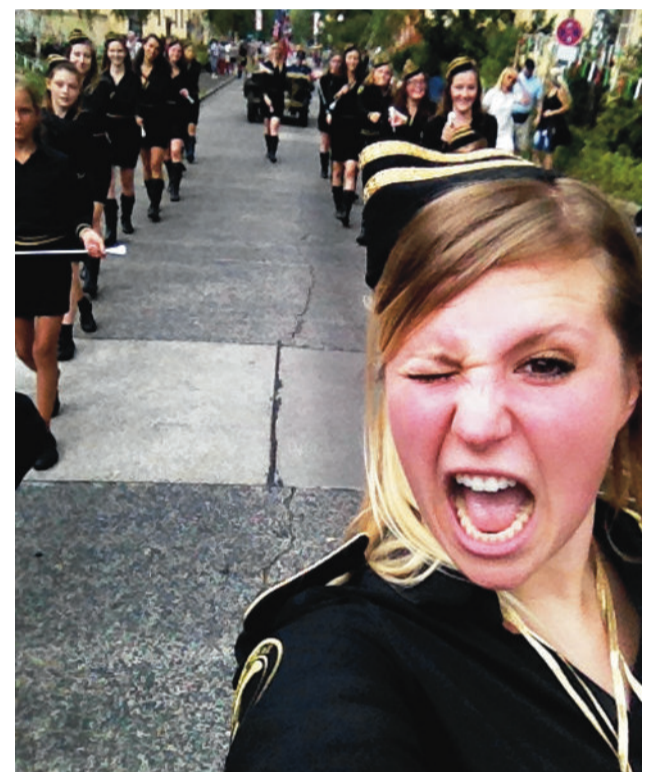
Schollenfest-Impressionen: Die Twirling-Girls des VfL Tegel

Zum 125. Geburtstag des VfL Tegel Berlin richtet die Abteilung Twirling und Cheerleading am 1. und 2. Oktober zum dritten Mal eine Deutsche Meisterschaft aus. In der Sporthalle des Romain-Rolland-Gymnasiums, Place Moliere 4 in der Cité Foch in Waidmannslust werden an beiden Tagen ab 8 Uhr bei freiem Eintritt in 173 Tänz die Deutschen Meister und Meisterinnen aus 10 Vereinen ermittelt. Täglich wird mit einer Standard