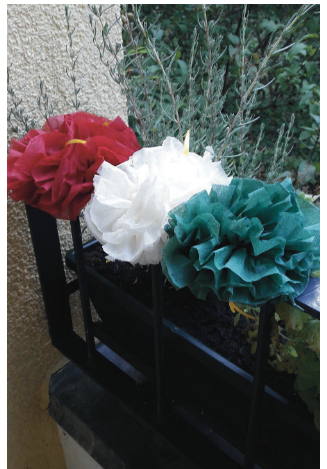
Bescheidener Festschmuck in der Rosentreterpromenade: chic und zur Nachahmung unbedingt empfohlen

Damit sind wir unserem Ziel dem Erwerb des Grundstücks ganz nahe gekommen. Doch mindestens eine Hürde ist noch zu nehmen. Die vielfältige Nutzung des Grundstücks in den vergangenen 100 Jahren hat manche Legende über die Art und den Umfang der Hinterlassenschaften früherer Nutzer entstehen lassen. Um sicher zu sein, dass diese Legenden mit der Wirklichkeit wenig gemein haben, lassen wir den Untergrund auf Herz und Nieren prüfen. Das Ergebnis lag bei Redaktionsschluss leider noch nicht vor. Doch wir gehen davon aus, dass wir das Grundstück noch in diesem Jahr kaufen können.